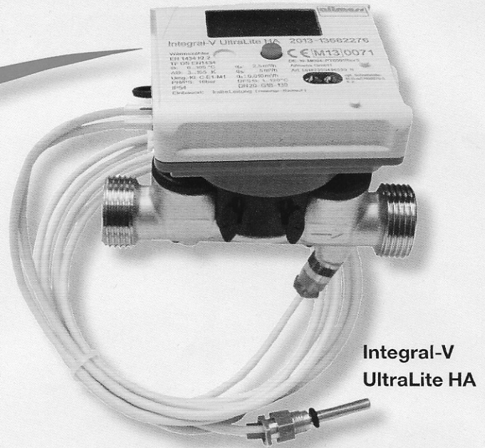
Integral-V UltraLite HA

Zum Beispiel für den Einsatz in Frischwarmwasserstationen mit Plattenwärmetauschern.